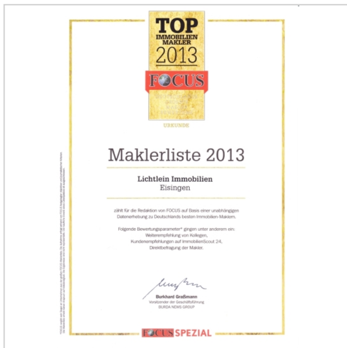
TOP Makler Urkunde