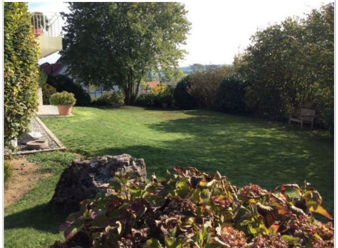
Außenbereich / Garten